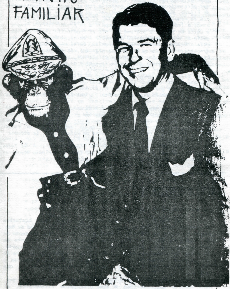
PAPA MONO Y SU HIJO PREFERIDO