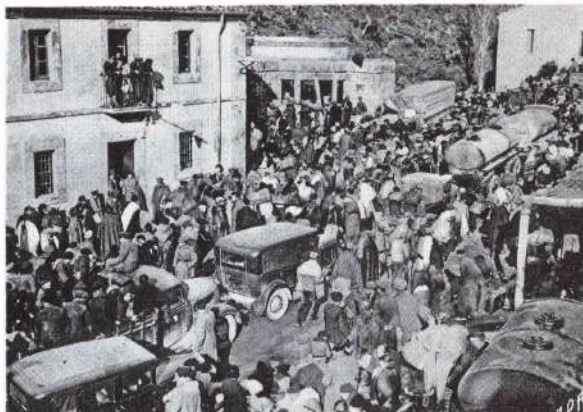
Paso fronterizo, El Pertús 1939