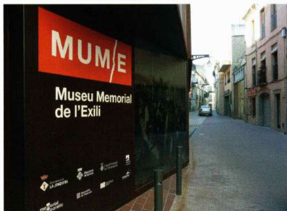
Museu Memorial del Exilio, la Jonquera