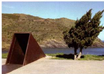
Memorial Pasajes de Dani Karavan, 1999

La ruta señalizada, llamada también ruta Lister, tiene unos 7 km y va desde Banyuls a Portbou por la montaña (por el Querroig), siguiendo los senderos por donde Benjamin cruzó la frontera en 1940, en plena Segunda Guerra Mundial.