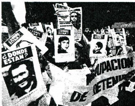
DETENIDOS DESAPARECIDOS. "Se debe develar toda la verdad de los desaparecidos", afirma el poeta.

La escritura de Inri, dice, fue "una experiencia extremadamente fuerte, porque desde el momento que sabía que todos los paisajes de Chile son el gran memorial, que Chile entero es un gran memorial de su violencia y sus crímenes, no pude ver más como veía antes".