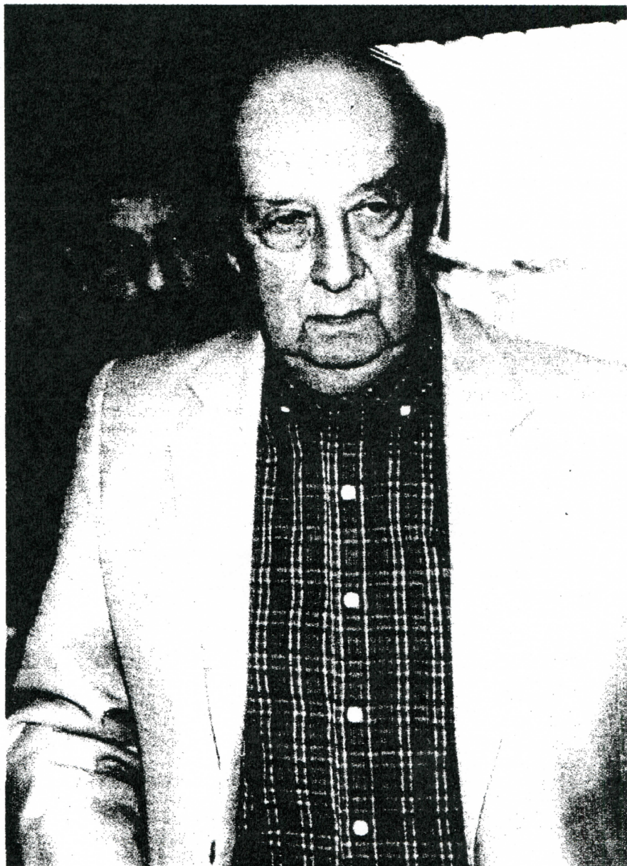
EL EX GENERAL CARLOS GUILLERMO SUÁREZ MASON fue procesado, entre otros delitos, por el secuestro y desaparición de militantes montoneros.

En las indagatorias el magistrado pediría explicaciones sobre los motivos por los que la conducción de Montoneros ordenó en febrero de 1980 que 15 militantes, entre ellos dos menores, regresaran a la Argentina dos meses después de haber salido exiliados, pese a que sabían que "la estructura logística estaba tomada por los servicios" de inteligencia, agregó Télam.