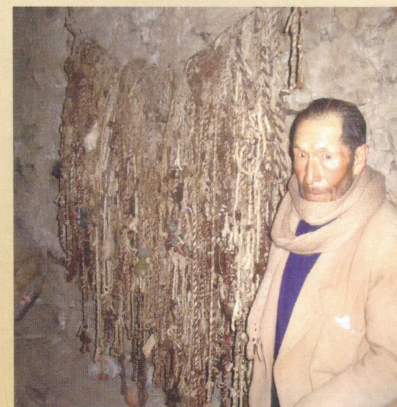
Comunidad Campesina de Rapaz (Oyón Lima) a 3,400 msnm, Quipu más antiguo del mundo 26 de junio de 2005.