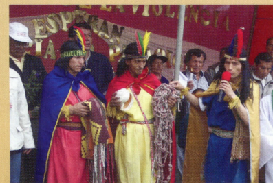
Construcción del Quipu en Fortaleza de Kuélap Amazonas y siembra de Alameda de la Memoria. Chasquis de Kuélap parten de Amazonas el 11 de mayo y llegan a Cajamarca el 24 de mayo de 2005.