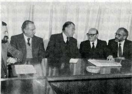
El abanderado presidencial de la Concertación por la Democracia, Patricio Aylwin.

Ello permite concluir que se ha producido una importante masificación del tema en la comunidad, superando los marcos más contestatarios que, inevitablemente, tuvo la cuestión