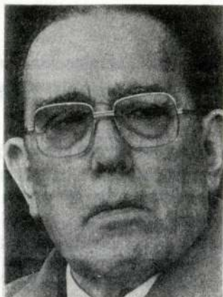
El Ministro de Justicia, Hugo Rosende

Por un reciente dictamen en contrario del Tribunal Constitucional, emitido a comienzos de agosto, el actual Ministro de Justicia, Hugo Rosende Subiabre, salvó de ser inhabilitado de su cargo por infracción a normas constitucionales y leyes vigentes en un juicio de cuasi delito de homicidio y de lesiones que afectó a cinco personas en la localidad de Frutillar, en la zona sur del territorio.