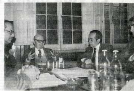
6. Andrés Zaldívar y Edgardo Riveros, del Partido Demócrata Cristiano.

pública favorable a la causa de los derechos humanos; contribuir a fomentar una pedagogía social sobre la materia en la sociedad, y facilitar al futuro gobierno democrático la tarea al respecto.