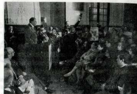
"No debe caber duda a nadie de la voluntad de la justicia..."