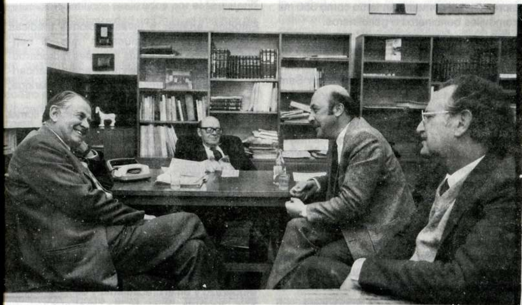
A su llegada a la CCHDH, se reunió con miembros del Secretariado

Su pleno convencimiento de que "la convivencia humana sólo es posible sobre la base de la verdad" manifestó el candidato de la Concertación por la Democracia a la Presidencia de la República, Patricio Aylwin, durante la visita que realizó a la sede de la CCHDH, oportunidad en que se reunió con sus trabajadores y con representantes de las agrupaciones de familiares de víctimas de la represión, el 17 de agosto último.