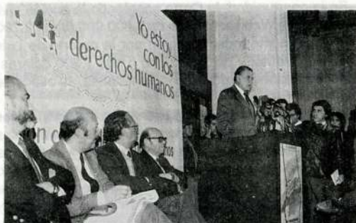
"Uds. han creado conciencia sobre el tema de los derechos humanos".

Añadió, que ello sin embargo, no es suficiente y que se deben establecer las responsabilidades de graves violaciones a las